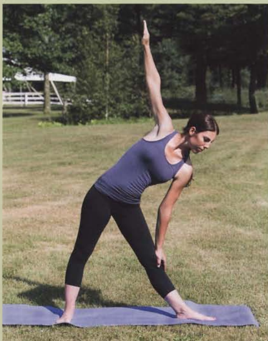
COURRIER HIPPIQUE VOLUME 28 • NO. 4

Pour des raisons mystérieuses, les cavaliers ont souvent l'impression de progresser uniquement lorsqu'ils sont à cheval. Évidemment, le travail visant à développer les qualités propres au cheval est essentiel pour faire évoluer le couple, mais qu'en est-il pour le cavalier lui-même? La souplesse, la musculation, l'équilibre, le rythme, la respiration, la concentration, pour n'en nommer que quelques-unes, sont toutes des qualités qu'un cavalier doit aussi développer ou perfectionner pour devenir plus compétente et, par le fait même, établir une meilleure relation avec sa monture.